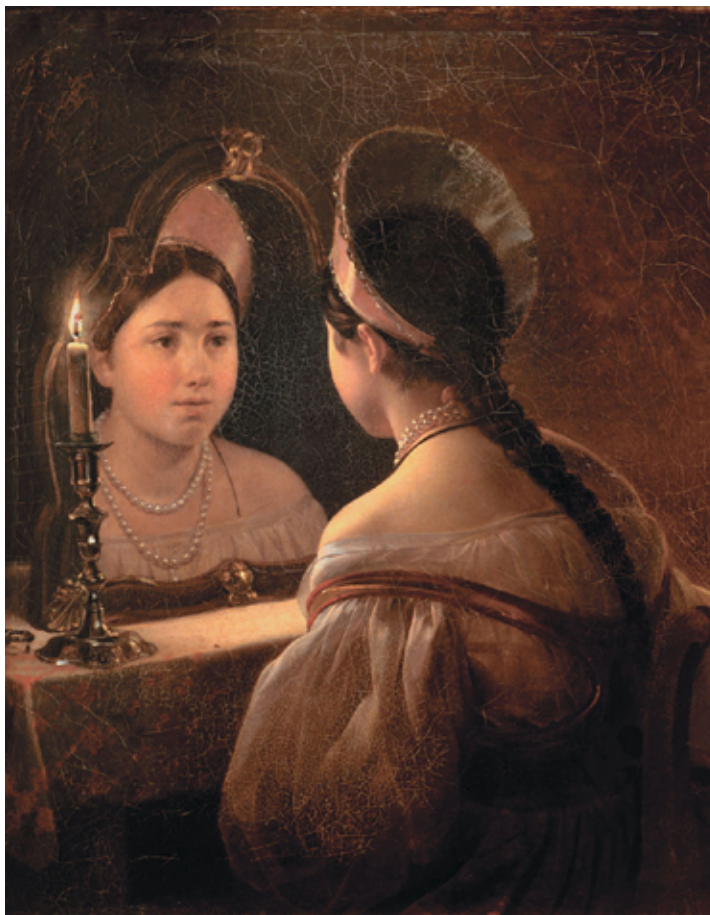
Карл Брюллов Гадающая Светлана, 1836