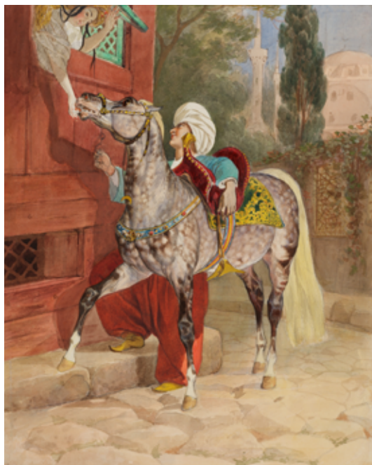
Карл Брюллов Любовное свидание в Константинополе, 1840