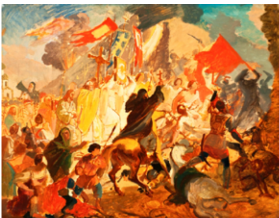
Карл Брюллов Эскиз картины «Осада Пскова польским королём Стефаном Баторием в 1581 году», 1836

От эскиза к картине. «Осада Пскова польским королём Стефаном Баторием в 1581 году» (1839-1843) и эскиз одноименного произведения (1836). Что изменилось в героях, композиции и колористическом решении Брюллова?