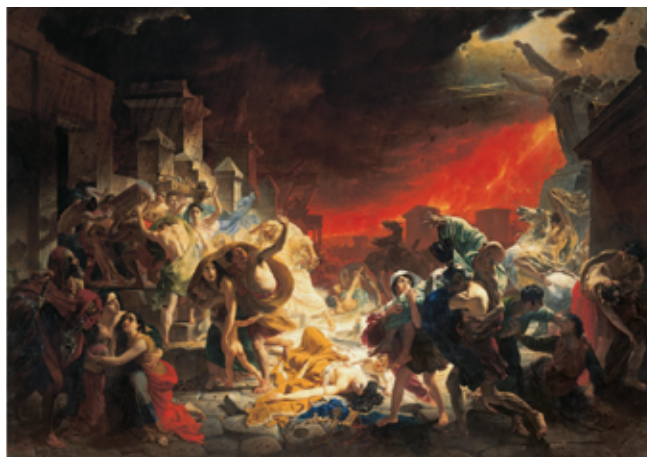
Карл Брюллов Последний день Помпеи, 1833

Академическая выучка и долгая жизнь в Италии сформировали широкий художественный кругозор Брюллова, который он регулярно применял при создании своих работ. Художник опирался на композиционные и колористические схемы, выразительные позы и жесты, оптические приемы, разработанные великими мастерами прошлого. Так, например, историки искусства сейчас полагают, что импульс для создания первых эскизов и основных фигурных композиций «Последнего дня Помпеи» дала фреска Рафаэля Санти «Пожар в Борго» (1514). Фигуры женщины, вскинувшей руки к небу, и сына, несущего своего отца, появляются уже в ранних эскизах Брюллова, и напоминают аналогичные фигурные композиции Рафаэля.