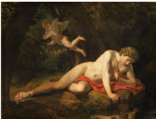
Карл Брюллов Нарцисс, смотрящийся в воду, 1819

Сравните мотив отражения в трех работах К. Брюллова: «Нарцисс, смотрящийся в воду» (1819), «Гадающая Светлана» (1836) и «Бахчисарайский фонтан» (1849).