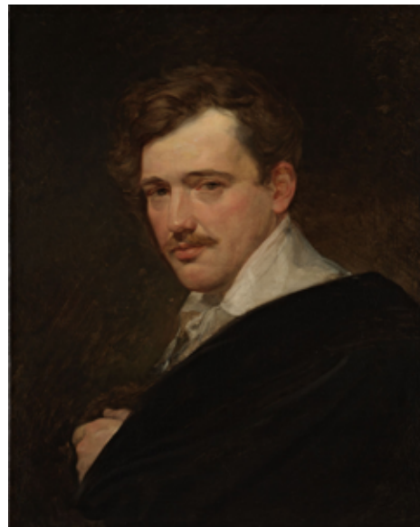
Карл Брюллов Портрет А. Н. Львова, 1824