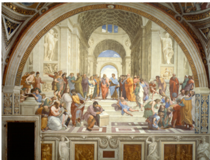
Рафаэль Санти Афинская школа, 1510-1511

Выберите несколько произведений Брюллова и проанализируйте их при помощи категории времени. Подумайте, как выставочное пространство, заложенные кураторами маршруты и точки зрения, смысловые и визуальные акценты соотносятся с выявленными Вами характеристиками времени в творчестве Брюллова.