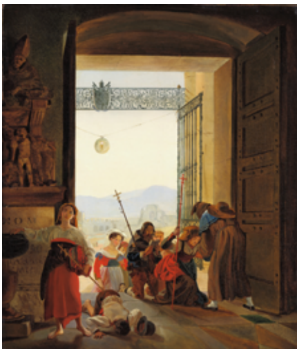
Карл Брюллов Пилигримы в дверях Латеранской базилики, 1825

Et in Arcadia ego. Образ Аркадии в трех картинах Брюллова 1825 года: «Пифферари перед образом Мадонны», «Пилигримы в дверях Латеранской базилики», «Вечерня».