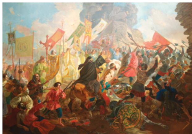
Карл Брюллов Осада Пскова польским королём Стефаном Баторием в 1581 году, 1839-1843