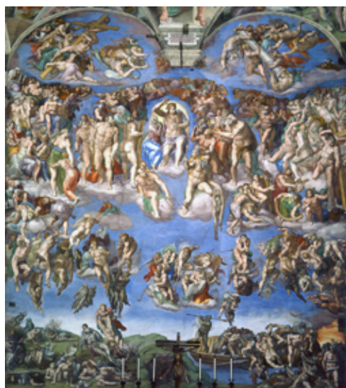
Микеланджело Буонарроти Страшный суд, 1537-1541