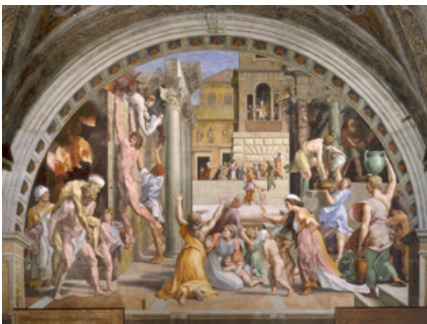
Рафаэль Санти Пожар в Борго, 1514

Брюллов как знаток искусства: цитаты и переосмысление произведений старых мастеров в живописи художника.