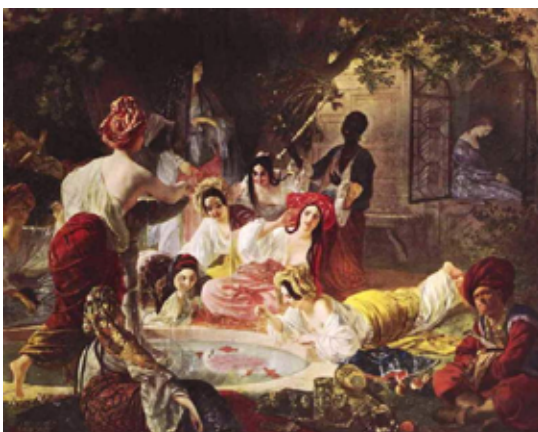
Карл Брюллов Бахчисарайский фонтан, 1849