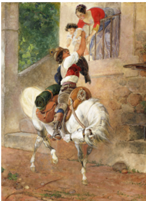
Карл Брюллов Возвращение римского пастуха домой, 1850-1851

Жанровая зарисовка в Риме и Константинополе: сходство и разница акварелей Брюллова «Любовное свидание в Константинополе» (1840) и «Возвращение римского пастуха домой» (1850-1851).