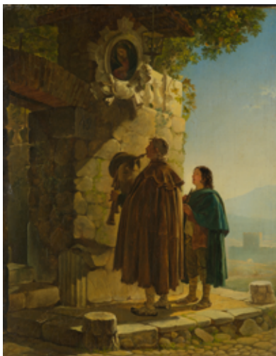
Карл Брюллов Пифферари перед образом Мадонны, 1825