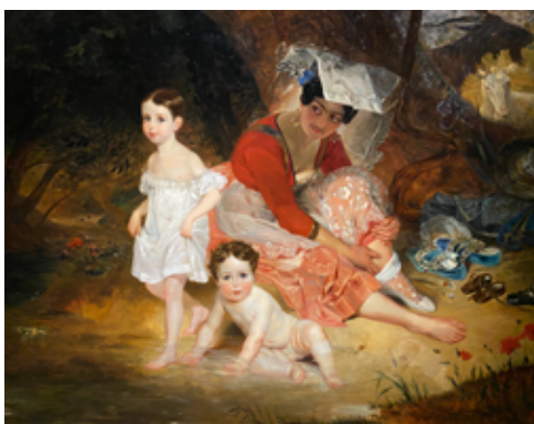
Карл Брюллов Портрет детей графа Льва Витгенштейна с няней-итальянкой, 1832

Роль натюрморта в портрете Брюллова на примере «Портрета детей графа Льва Витгенштейна с няней-итальянкой» (1832) и «Портрета А.М. Бек с дочерью» (1840).