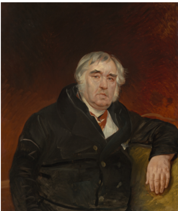
Карл Брюллов Портрет И.А. Крылова, 1839

Мужской портрет на красном фоне. Сравнение портрета И.А. Крылова (1839) и портрета А.Н. Струговщикова (1840).