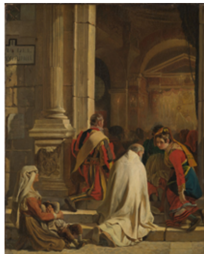
Карл Брюллов Вечерня, 1825