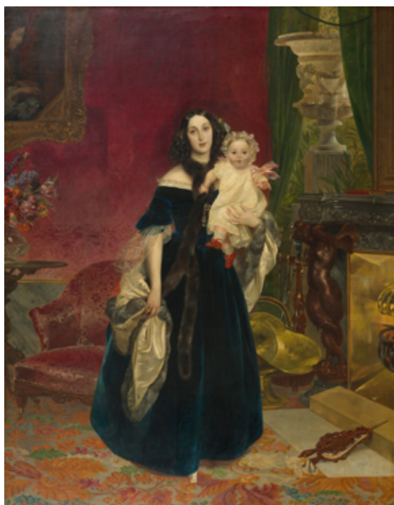
Карл Брюллов Портрет М.А. Бек с дочерью, 1840